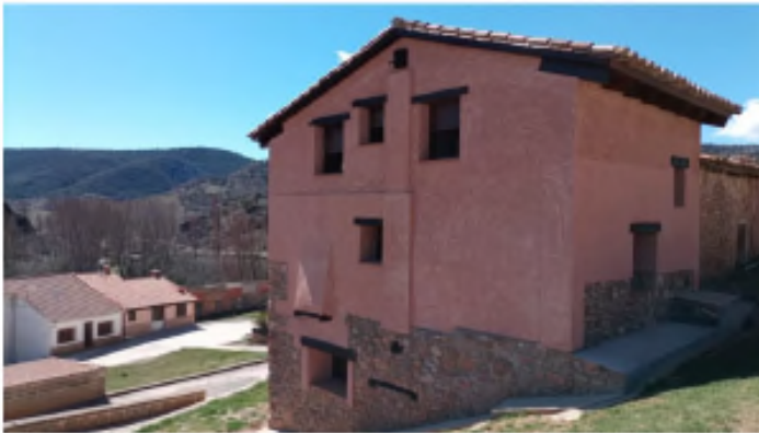
Fachada de la vivienda que se ha rehabilitado en Tramacastilla para acoger a nuevos pobladores

Tramacastilla acondiciona una vivienda para destinar a una familia de nuevos pobladores