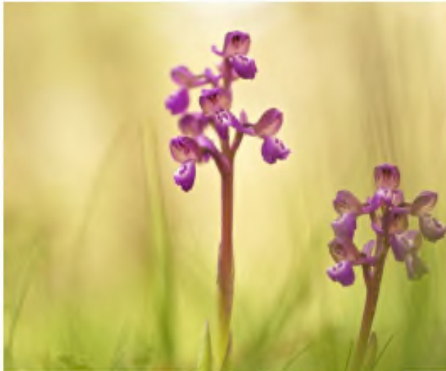
Anacamptis grupo maritima, o caballo entre dos especies, 'A. dampfiana' y 'A. maritima', por eso se mezcla en un grupo