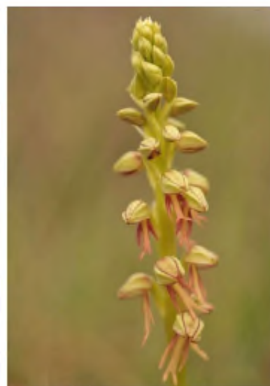
' Orchis anthropophora '