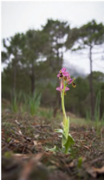
'Ophrys sphegodes' que se ve en las praderas de la sierra de