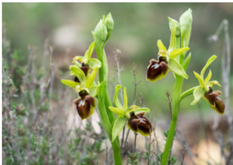
' Ophrys sphegodes ' fotografiada en la Sierra de Albarracín. J. A.B.M.