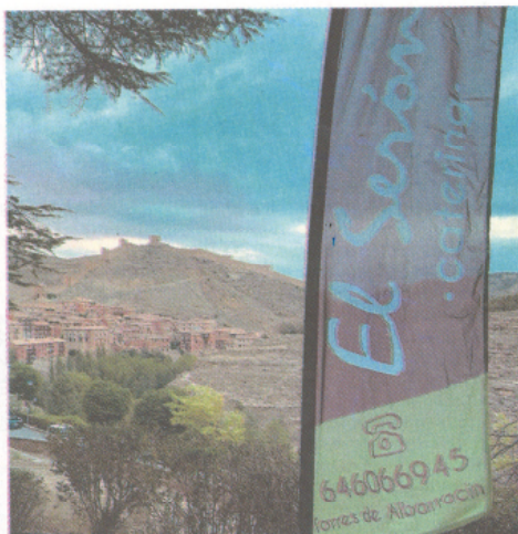
El Serón ofrece servicio de catering y conservas en Torres de Albarracín