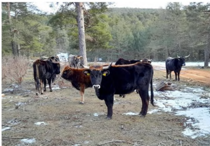
Los tauros que hay en la zona de Frías de Albarracín

TERUEL BAJO ARAGON COMARCAS CULTURA DEPORTES EN LA ÚLTIMA OPINION EDICION DIGITAL HEMEROTECA SOCIEDAD