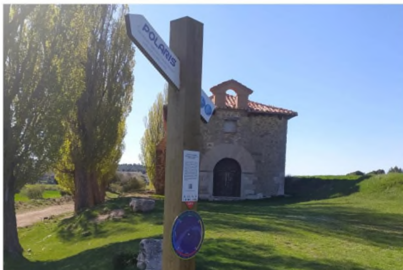
Señal para ayudar a la observación astronómica en Jabaloyas

TERUEL BAJO ARAGÓN COMARCAS CULTURA DEPORTES EN LA ÚLTIMA OPINIÓN EDICIÓN DIGITAL HEMEROTECA SOCIEDAD