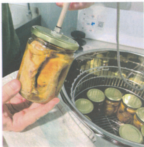
Proceso de envasado de uno de los productos típicos de El Serón