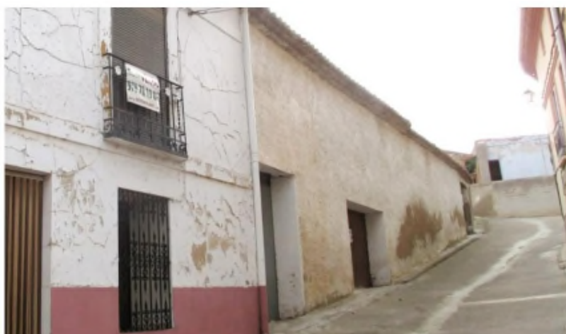
Cartel de una inmobiliaria en una casa en un pueblo de Teruel. Archivo

TERUEL BAJO ARAGÓN COMARCAS CULTURA DEPORTES EN LA ÚLTIMA OPINIÓN EDICIÓN DIGITAL HEMEROTECA SOCIEDAD