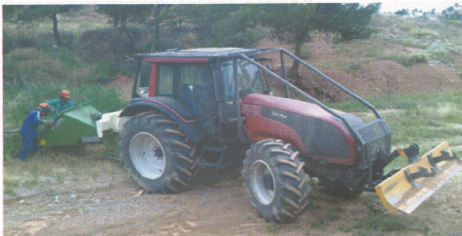
Parte de la cuadrilla de la Cooperativa Forestal de Royuela durante tareas de limpieza de terreno forestal