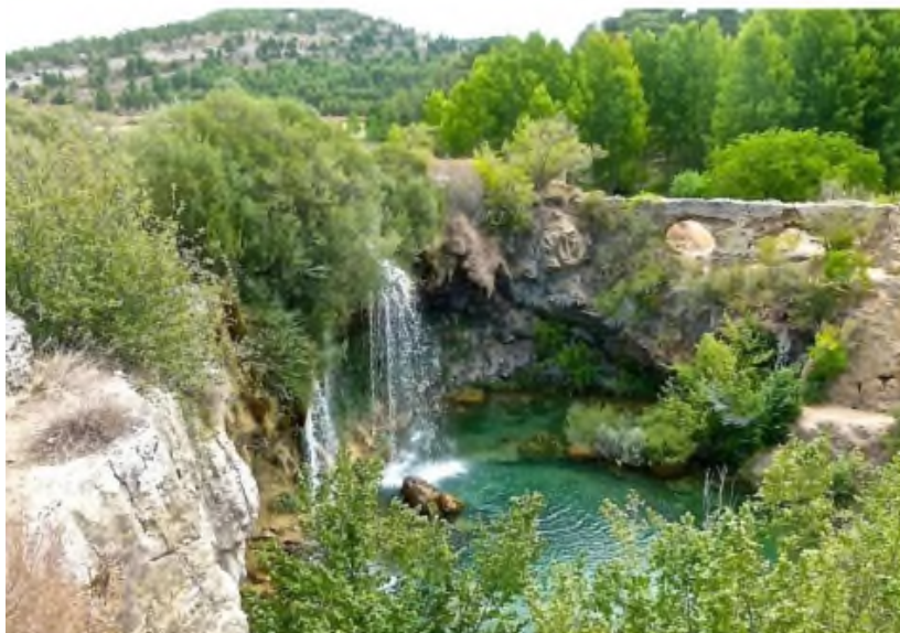
Paraje de la Reserva de la Biosfera del Valle del Cabriel